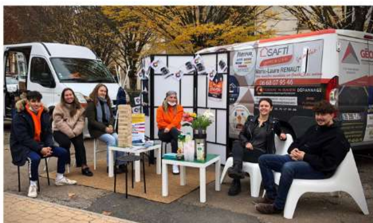
Partie de l'équipe du projet sur le marché local / MJC Graulhet.

L'objectif principal est de repérer et de recruter les jeunes invisibles du bassin graulhetois afin de les accompagner vers des parcours intermédiaires individualisés et de les suivre jusqu'à leur (re)mobilisation sur les dispositifs de droit commun. En bref, créer une relation de confiance afin que les jeunes aient à leur disposition toutes les informations dont ils ont besoin.